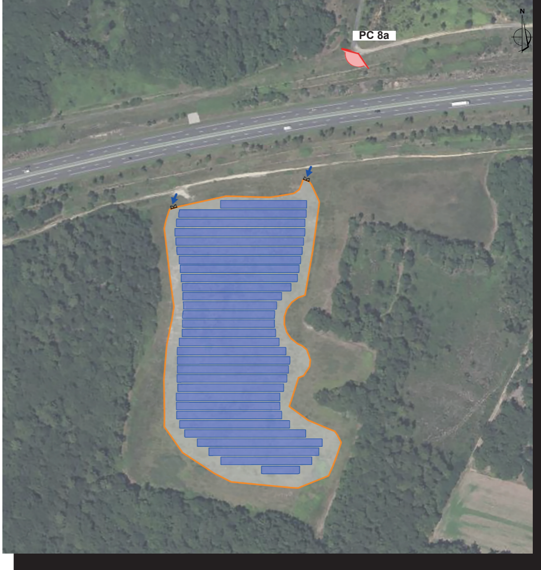
PLAN DE REPÉRAGE DE LA VUE