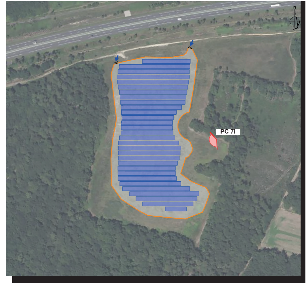
PLAN DE REPÉRAGE DE LA VUE