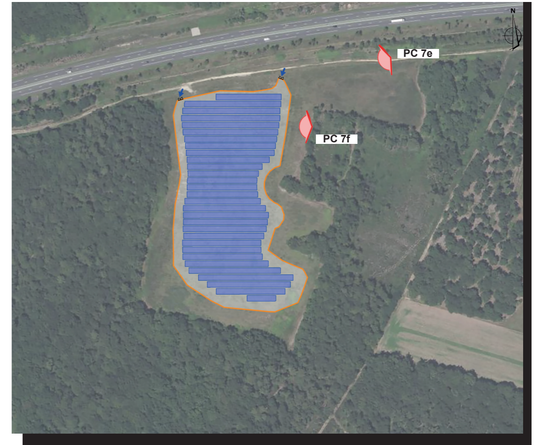
PLAN DE REPÉRAGE DES VUES