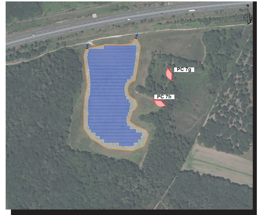
PLAN DE REPÉRAGE DES VUES